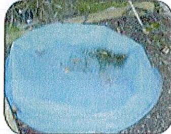
Vacía las piscinas que no estén en uso.