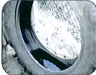
Fiecle los neumáticos usados o manguitos prangidos de la llanta.