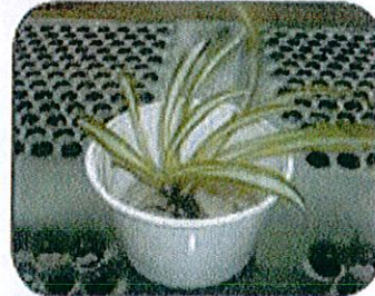
Ponga las plantas en tierra, no en agua.