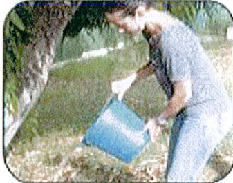
Vacía el agua acumulada.