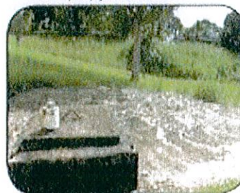
Mantenga el pozo séptico sellado.