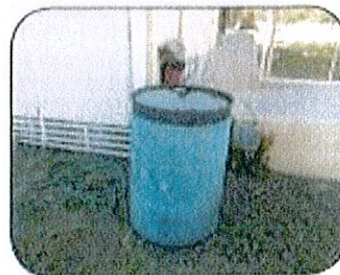
Mantenga los barriles para el agua de lluvia bien tapados.