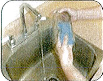
Restriegue los fioresos y envases semanalmente para eliminar los huecos de mosquitos.

National Center for Emerging and Zoonotic Infectious Diseases Division of Vector-Borne Diseases